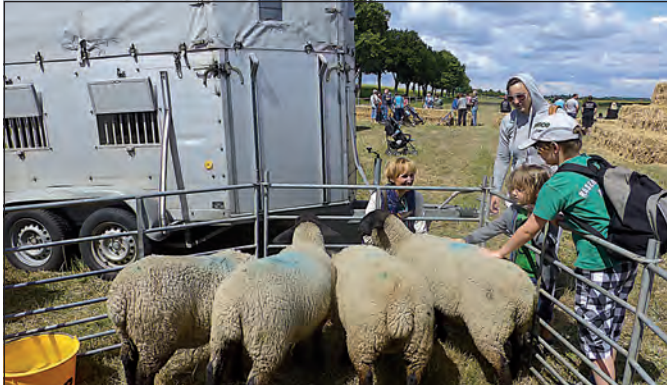
Streicheleinheiten am Ranziger Feldrand.

Wie in jedem Jahr waren auch bei uns einige Landwirtschaftsunternehmen kürzlich an der Landpartie beteiligt. In der Agrarogenossenschaft Ranzig fand mit Ochse am Spieß und Blasmusik die Eröffnung für unseren Landkreis statt. Mit Sonderbusfahrten konnte man die Felder und