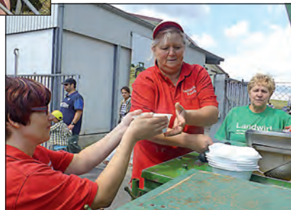
Lecker deftiges aus der Gulaschkanne der Agrarogenossenschaft.

resse für das Leben und Arbeiten im dörflichen Bereich gewonnen werden. Doch auch Kunst und Natur konnten an diesem Tag genossen werden, wie in Steinhöfel das „Alte Amtshaus“ mit seinem wunderbaren Garten. Danke an alle Mitakteure, an die Bauern und die Landfrauen und alle Mitarbeiter der Höfe.