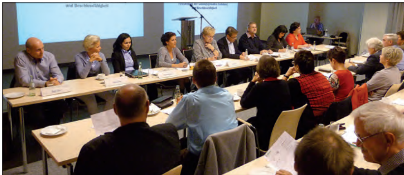
Wahlveranstaltung in Bad Saarow: Der Vereinsvorstand wurde einstimmig bestätigt.